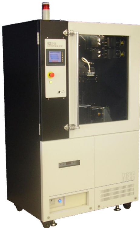
Electrospinning Setup NF-103v